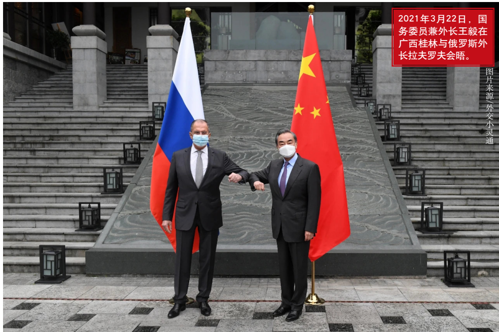
2021年3月22日，国务委员兼外长王毅在广西桂林与俄罗斯外长拉夫罗夫会晤。

“条约”见证了两国合作基础的不不断夯实。中国和俄罗斯同为新兴市场国家，双方的经济各具优势，在很多领域有较强的互补性，但存在相互投资有限、贸易结构不合理以及一些人为障碍等问题，特别是20世纪90年代由于起点很低，发展不够稳定，中俄经贸合作长时间难以取得较大突破。“条约”确定了经贸合作的重点领域，发挥了重要的指导作用，使中俄经贸合作进入一个快速发展的通道。双方的相互投资逐年增长，大项目合作取得积极成果，农业、旅游、卫生、体育合作展现出良好前景，两国在科技创新、电子商务、人工智能领域不断激发合作潜力。当前两国的务实合作已扩展至金融、能源、航空航天、运输、核能、高铁、信息技术等多个领域，合作