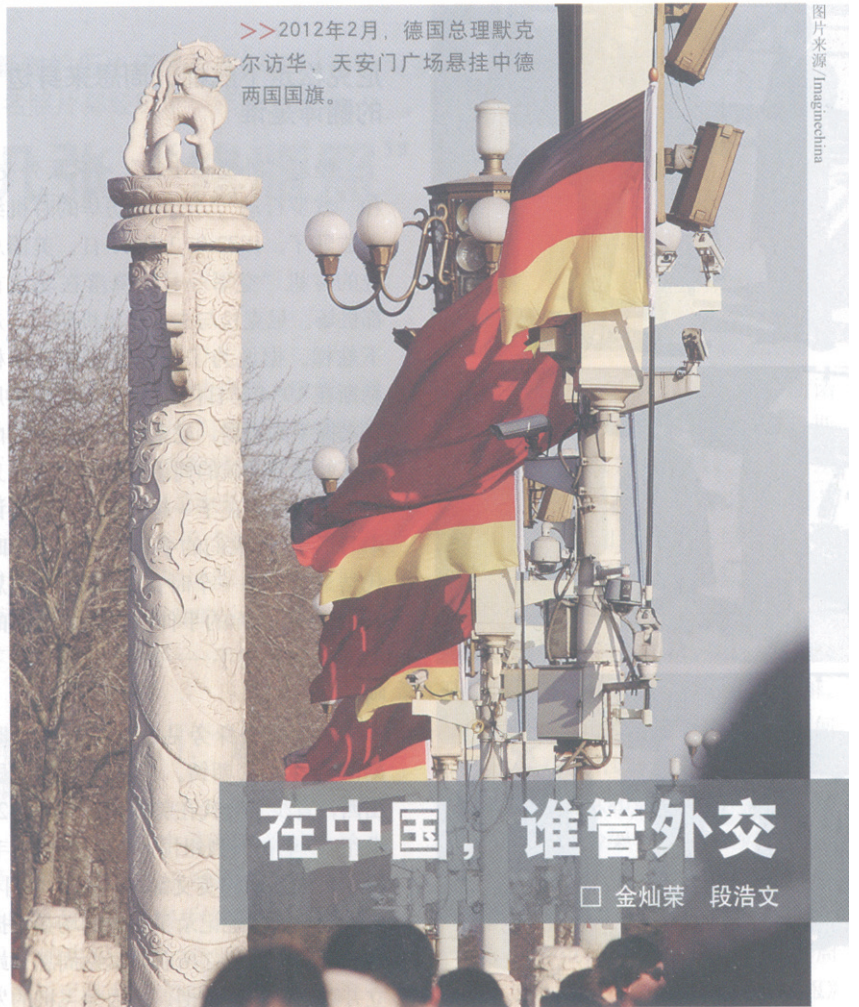
>> 2012年2月，德国总理默克尔访华，天安门广场悬挂中德两国国旗。