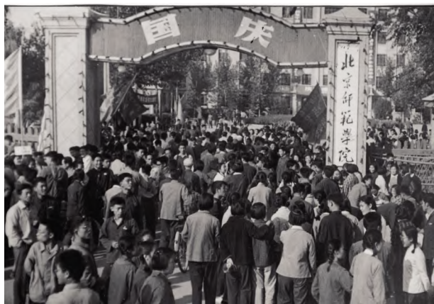
1965年北京师范学院成立十周年盛况

北京市委市政府响应中央规划,积极谋划首都高等师范教育发展。北京市委主要领导同志在1950年代初即提出要求北京的中小学教育应站在全国的前列。中学教育的大发展需要兴办新的中学,并对现有中学进行扩招,当时最棘手的问题是师资缺乏,必须大力兴办高等师范教育才能解决。1954年6月23日,北京市委下发《关于提高北京市中小学教育质量的决定》,也明确提及“提高中小学教育质量的关键在于师资队伍的建设。北京解放以后中小学教育发展很快,师资没有可靠来源” [4] 。1954年7月3日,北京市教育局党组经北京市委同意向教育部提交申请,“北京中学师资近年来因为没有可靠来源,收得很滥,致使教育质量的提高受到了严重的影响” [5] ,为解决这一问题,1954年开始筹备建设一所新的师范学院,为北京市不断发展壮大的中学培养亟须的师资。