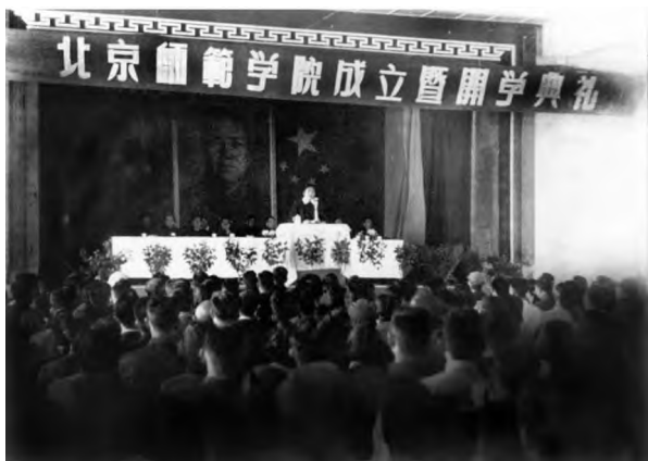
1955年北京师范学院成立暨开学典礼

北京是近代中国高等师范教育的发源地,近代中国最早的高等师范教育机构和第一所专门的高等师范院校均诞生于此。1902年10月14日,京师大学堂正式举行师范馆速成科招生考试,当年分两批共招录146人。12月17日,师范馆正式开学,近代中国高等师范教育由此开始。1908年,在张之洞倡议下师范馆从京师大学堂独立出来,校名为“京师优级师范学堂”。