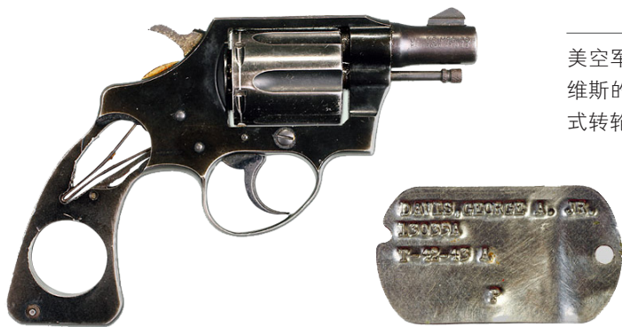
美空军“王牌驾驶员”戴维斯的遗物：柯尔特刑警式转轮手枪、军号牌

三是在保卫目标、独立作战中创新战术。 1952 年 6 月，美国空军在其实施的“绞杀战”彻底失败以后，遂将其空中力量作为使用的重点，转向轰炸朝鲜北方的主要城镇和重要的工业设施，并对位于鸭绿江南岸、龟城以北的水丰发电厂进行大规模的轰炸。从 7 月起，志愿军空军根据“以保卫目标为主”的方针，将空战任务转为保卫水丰发电厂、鸭绿江桥及平壤、元山以北运输线等主要目标。此时，志愿军空军先后已有 9 个歼击机师完成了实战锻炼任务，并能独立作战。各参战部队在作战中，根据美国空军活动的规律、特点，大胆创造出许多新型战术，除著名的“一域多层四四制”战术原则之外，还有许多日后被美军归纳命名的战术，如“鱼饵”战术、“口袋”战术、阶