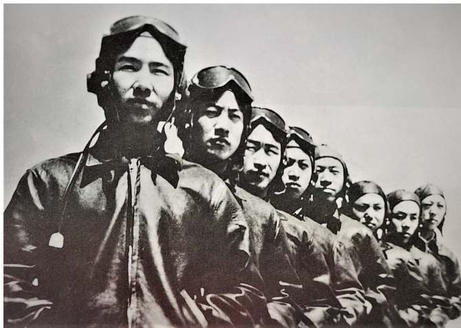
王海（前1）大队在朝鲜战场共击落击伤美机29架，王海本人击落击伤9架

空3师的领导班子成员大都来自红军和八路军的老同志，而且基本上是华北军区步兵第209师的领导班子，第209师的领导班子多数来自第6军分区。自抗日战争时期至空3师成立，该领导班子历经成百上千次战役战斗和多次体制编制调整，人员基本没有发生变化。由此可以看出：空3师的领导班子是