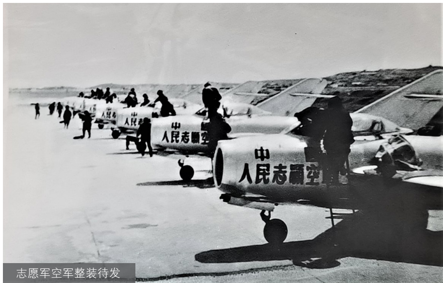
志愿军空军整装待发

志愿军空军历经两年零八个月的实战锻炼,形成了强大的战斗力,对于今天空军加快转变战斗力生成模式具有重要的借鉴意义,是我们取之不尽、用之不竭的宝贵财富。(编辑:安宇衡)○