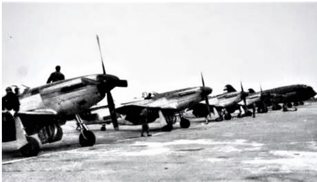
南苑机场的 P-51 战斗机

在抗美援朝空中作战中，志愿军空军在飞机数量少、飞行员训练时间短的情况下，面对拥有 1100 余架作战飞机、飞行员飞行时间多在 1000 小时以上的美国空军，全体指战员在“闻战则喜、英勇顽强、