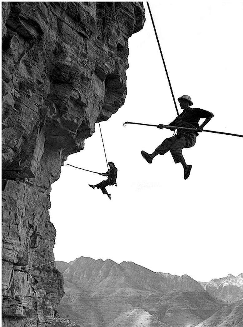
除险队员凌空除险

林县人修建红旗渠首先遇到的最大困难是经济问题,当时县财力十分有限,想靠国家给钱国家有困难,想靠上级投资上级也缺款,如果等到形势好转后再修建,错过这个机会林