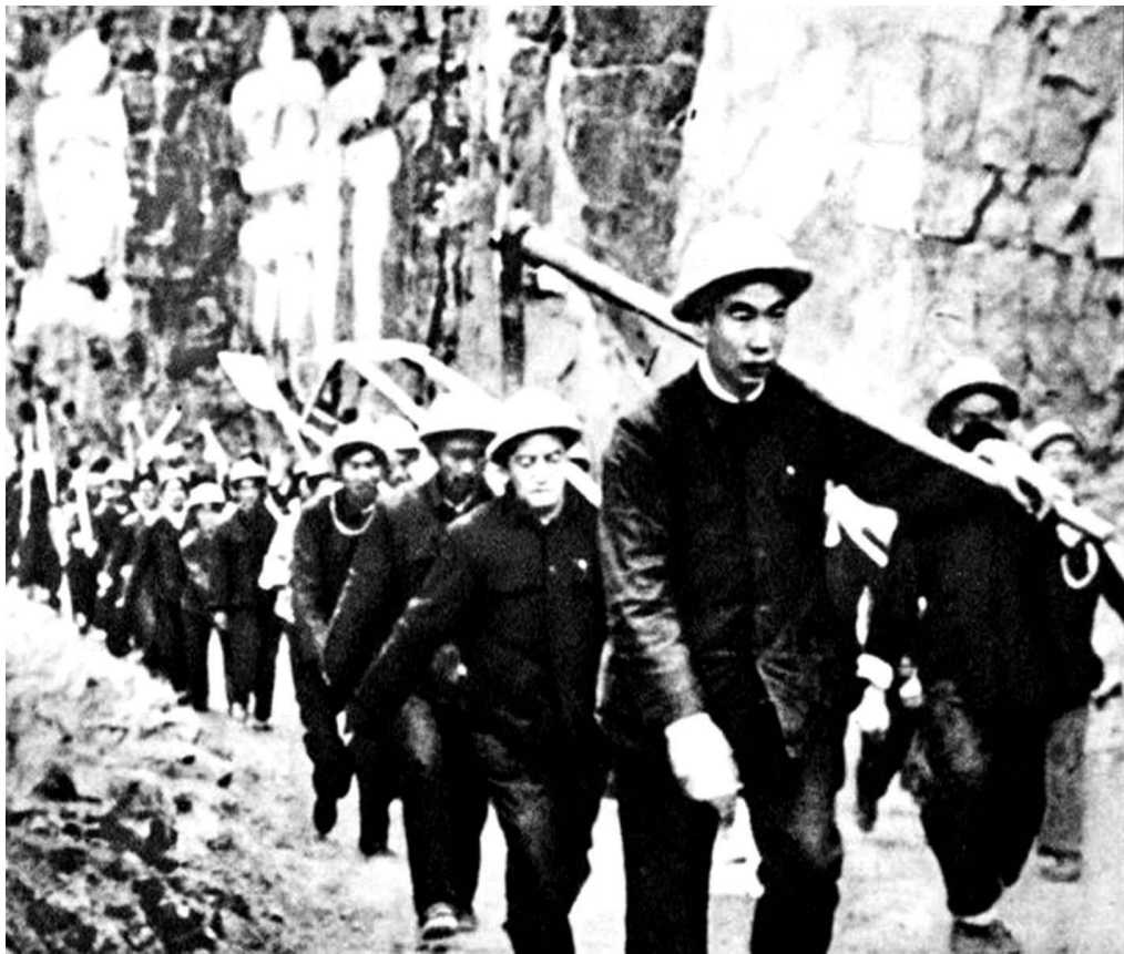
1960年,林县县委书记杨贵(前)肩扛铁镐带头上山修渠

林县县委领导成员大都是本地人,大都从小遭遇过因缺水而带来的苦难,因此大家对解决林县干旱缺水的问题有着非常一致的意见。县委一班人经过进一步的分析研究,一致认为必须首先解决水的问题,才能使林县摆脱贫困。