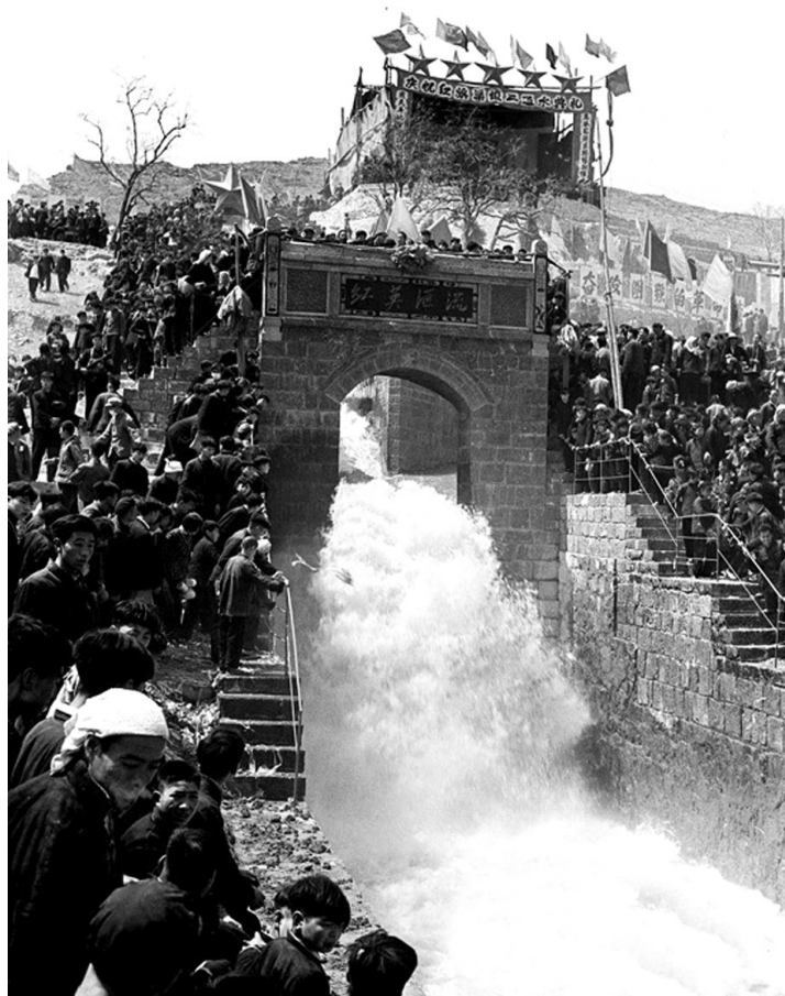
红旗渠通水的日子,十里八乡的人们争相目睹水到来的时刻

1960年2月11日,红旗渠总干渠动工,渠首建在山西省平顺县石城镇侯壁断下,将漳河水引入林县。至1969年7月6日,历时10年的红旗渠工程全部建成通水。