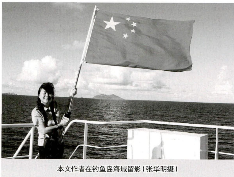
本文作者在钓鱼岛海域留影

“日本海保厅 PLH09 船，钓鱼岛及其附属岛屿自古以来就是中国固有领土，你船的行为已经侵犯了中华人民共和国主权及主权权