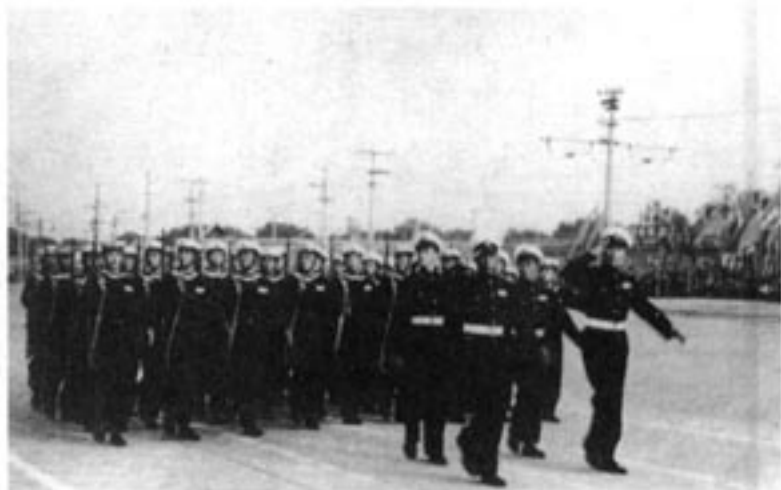
中国人民解放军海军接受检阅

中华人民共和国的成立开辟了中国历史新纪元。从此，中国结束了一百多年来被侵略被奴役的屈辱历史，真正成为独立自主的国家；中国人民从此站起来了，成为国家的主人。