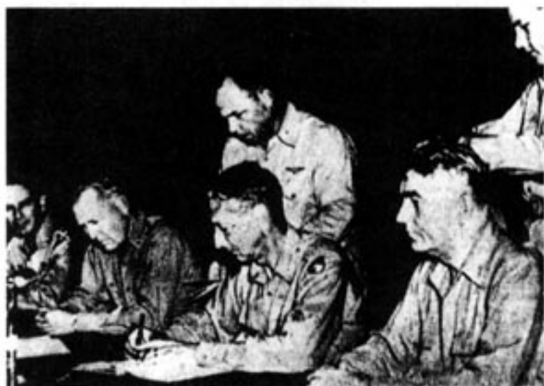
美国陆军上将、“联合国军”总司令克拉克在停战协定上签字