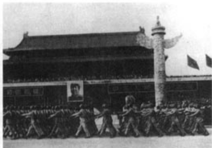
中国人民解放军陆军经过天安门广场接受检阅