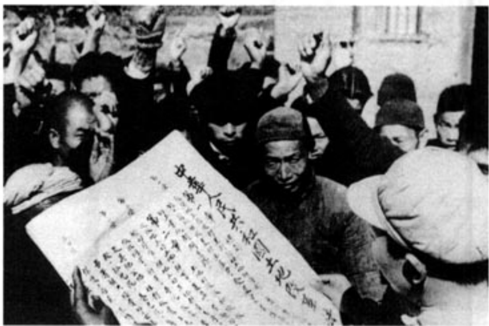
向农民宣传土地改革法

新中国成立后，占全国三亿多人口的新解放区还没有进行土地改革，广大农民迫切要求进行土地改革，获得土地。1950年，中央人民政府颁布《中华人民共和国土地改革法》，它规定废除地主阶级封建剥削的土地所有制，实行农民的土地所有制。同年冬起，全国分批进行土地改革，没收地主的土地，分给无地或少地的农民耕种。同时也分给地主应得的一份，让他们自己耕种，自食其力。到1952年底，除