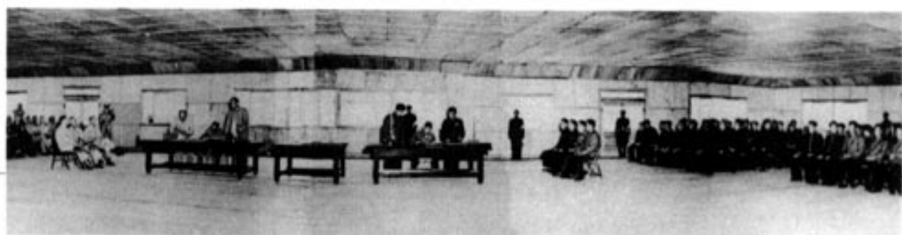
朝鲜战争的作战双方在板门店签署停战协定

“三八线”是位于朝鲜半岛上北纬38度附近的一条军事分界线。第二次世界大战结束后，盟国协议以朝鲜国土上北纬38度线作为苏、美两国对日军事行动和受降范围的暂时分界线，北部为苏军受降区，南部为美军受降区。后来，三八线北部建立了朝鲜民主主义人民共和国，南部建立了大韩民国。三八线长度248千米，宽度大约4千米。双方一度都有重兵把守，并互相播放广播。近几年局势缓和，基本没有冲突，双方的广播对峙也已经停止。