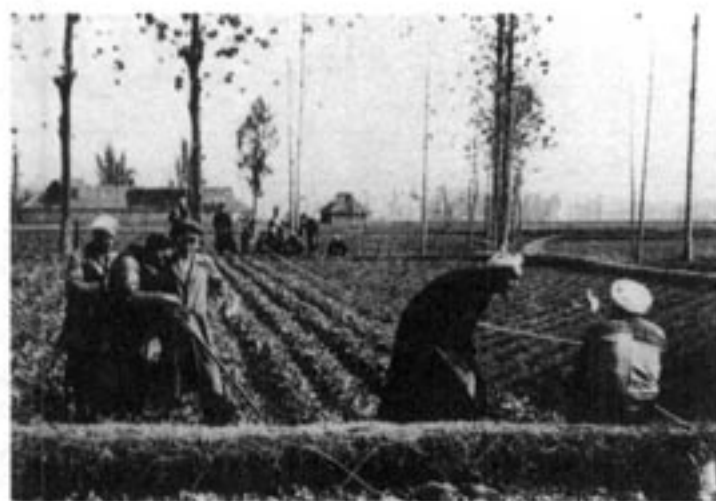
农民丈量分配土地