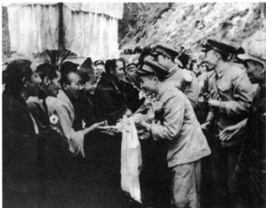
进藏的人民解放军受到西藏各界人民的欢迎

西藏自古以来就是中国的领土。人民解放军在解放西南各省以后，一面向西藏进军，一面力争西藏和平解放。中央人民政府多次希望西藏地方政府派代表到北京谈判。1951年，西藏地方政府派出以阿沛·阿旺晋美为首席代表的代表团到达北京，与中央人民政府谈判，双方达成了和平解放西藏的协议，西藏获得和平解放。至此，祖国大陆获得了统一，各族人民实现了大团结。西藏和平解放后，同年9月，人民解放军先遣支队进驻拉萨，受到西藏地方政府和市民的热烈欢迎。