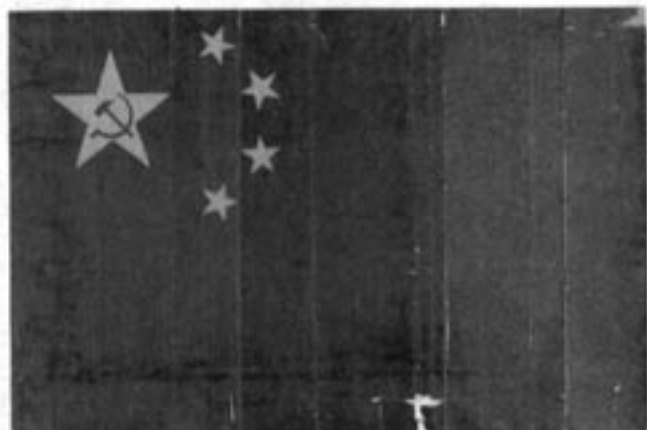
曾联松设计的国旗图案

里含代表工农的锤子镰刀，大五角星的右方是围绕着大五角星的四个小五角星。政协最后决定把大五角星里的锤子镰刀去掉，用五星红旗作为中华人民共和国的国旗。国旗的象征意义是：“红色象征革命，旗上的五颗五角星及其相互关系象征共产党领导下的革命人民大团结。”