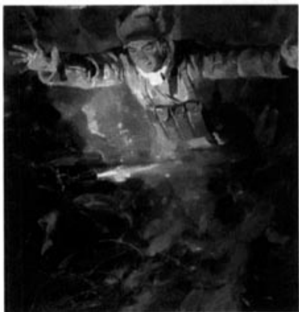
黄继光冲上去，用身躯堵住敌人机枪射口

黄继光是上甘岭战役中的一位战斗英雄。这个战役历时四十多天，敌人先后投入六万多兵力，向不足四平方公里的我军阵地上，倾泻近二百万颗炸弹和炮弹，把上甘岭化为一片焦土，山头被削低两米。志愿军发扬爱国主义和革命英雄主义精神，顽强坚持战斗。在一次战斗中，黄继光用身躯堵住敌人的机枪射口，掩护战友夺回阵地，自己壮烈牺牲。上甘岭战役最后取得了胜利。