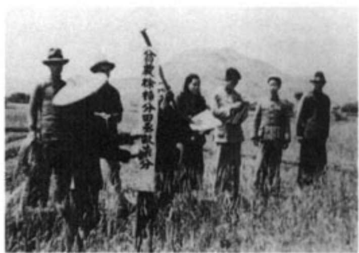
四川金堂县贫农分到了土地

全国约有三千五百万人口的少数民族地区，中央人民政府决定分别不同情况，用更长的时间，采取适合少数民族的特点和有利于民族团结的政策，来完成民主改革的任务。1959年，西藏地区进行了民主改革，中心任务是把封建农奴主土地所有制，改变为农民土地所有制，彻底消灭封建农奴制度。将近两年的时间里，西藏地区完成了以土地改革为中心的民主改革。