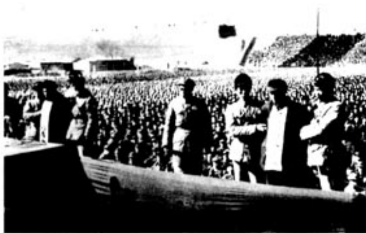
公审刘青山（右）、张子善（左）的大会会场

刘青山、张子善都是老共产党员、党的高级干部，在战争年代出生入死，为革命作出过一定的贡献。但革命胜利以后，他们在担任领导干部职务期间，却利用手中的权力贪污、盗窃国家财产达171.62亿元 ① ，堕落成人民的罪人。案发后，中共