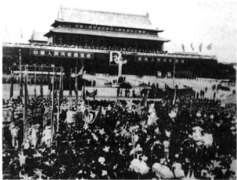
北京人民群众在天安门广场欢庆新中国的诞生