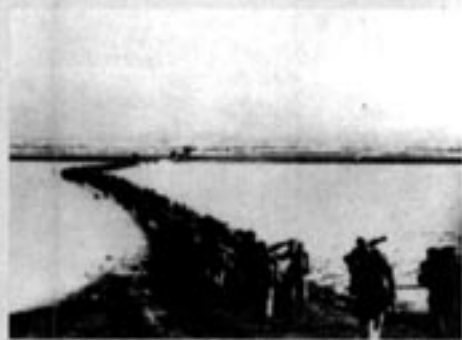
中国人民志愿军跨过鸭绿江