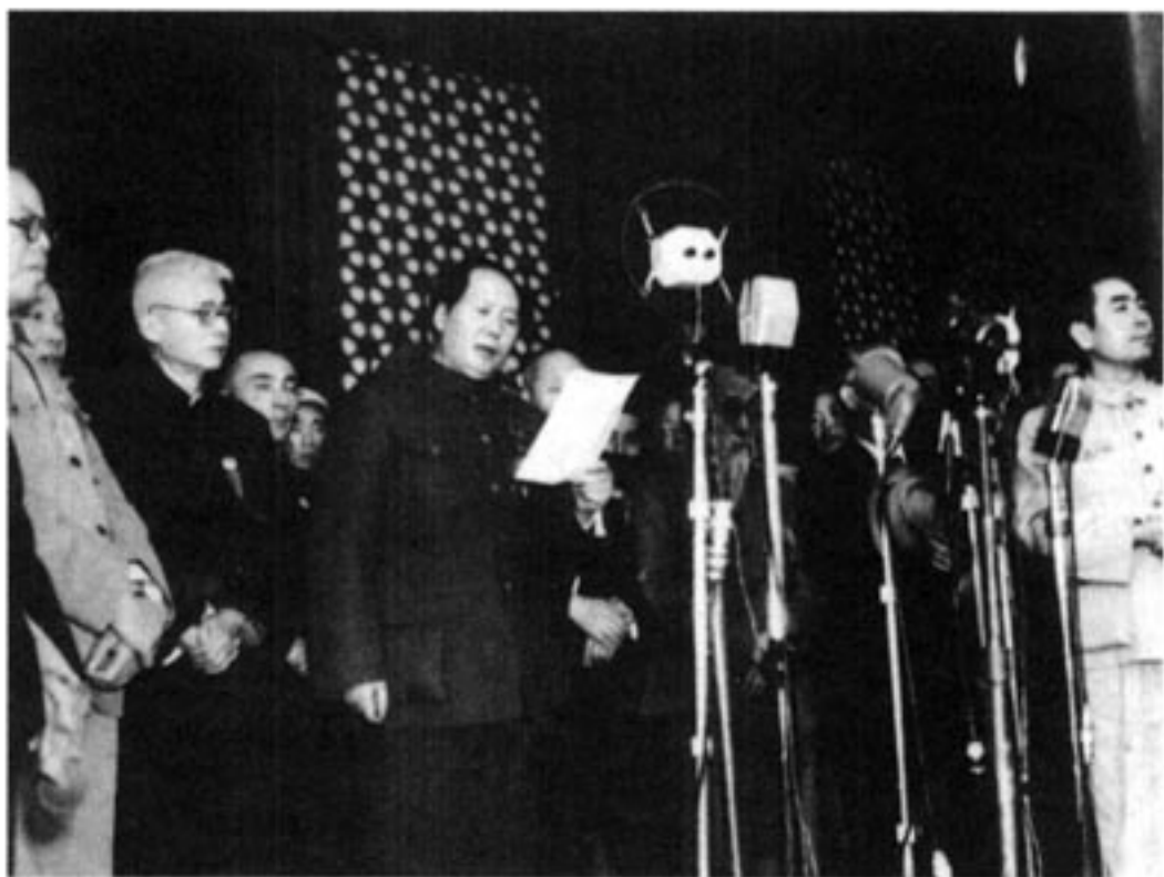
毛泽东主席在天安门城楼宣告：中华人民共和国中央人民政府今天成立了！

10月1日下午，毛泽东等国家领导人登上天安门城楼，首都30万军民齐集天安门广场，隆重举行开国大典。毛泽东向全世界庄严宣告：中华人民共和国中央人民政府今天成立了！他亲自按动电钮，一面鲜艳的五星红旗在天安门广场冉冉升起。这时，乐队奏起《义勇军进行曲》，54门礼炮齐鸣28响。广场上响起暴风雨般的欢呼声，欢庆新中国的诞生。毛泽东宣读了中央人民政府公告，宣布，本政府为代表中华人民共和国全国人民的惟一合法政府。接着，盛大的阅兵式和群众游行开始。